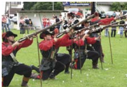
W Krzęcinie pokaz XVII-wiecznej musztry dało Kieleckie Bractwo Artyleryjskie

Czesi walczyli od 1618 roku o odzyskanie niepodległości i swobody religijnej. Po krwawym stłumieniu I powstania, chwycili za broń po raz drugi w 1626 r. Ale i wtedy zostali pokonani, a część z nich wybrała emigrację i wspólną walkę u boku Duńczyków. W 1627 roku koło Granowa spotkało się po raz kolejny w walce przeciwko sobie, wielu oficerów, którzy przed siedmioma laty walczyli w bitwie na Białej Górze przeciwko cesarzowi. Pod tym względem bitwę granowską można by