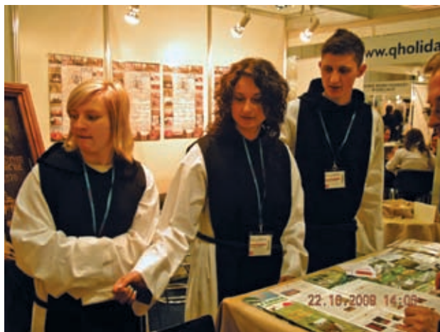
Tour Salon 2009

go Stowarzyszenia i wykaz gmin członkowskich. Osoby obsługujące stanowisko udzielały zainteresowanym informacji oraz wywiadów. Dzięki temu rozpowszechniono i wypromowano szlak cysterski i region, który on obejmuje. Można mieć nadzieję, że uczestnictwo w Międzynarodowych Targach Poznańskich TOUR SALON 2009 zaowocuje rozwojem gmin będących członkami Ogólnopolskiego Stowarzyszenia Gmin Cysterskich poprzez wzrost atrakcyjności miejsc i regionów co przyczyni się do wzrostu liczby turystów.